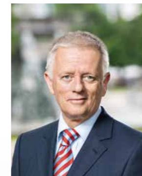
Fritz Kuhn Oberbürgermeister der Stadt Stuttgart

Dabei konnte sich die Stadt Stuttgart mit der Firma Wolfer & Goebel Bau GmbH über all die Jahre auf einen verlässlichen Partner beim Bau zahlreicher, bedeutender Bauwerke verlassen. Dazu zählt mit der Oberpostdirektion 1925 in der Lautenschlagerstraße das erste Hochhaus nicht nur in Stuttgart sondern in ganz Württemberg. Auch im Bereich der Infrastruktur konnten wichtige Projekte verwirklicht werden. Mit dem Umbau des Wagenburgtunnels für den Verkehr 1958 entstand der bis dahin längste Straßentunnel Deutschlands. Wegweisend für die Verkehrsplanung war der Bau des Stadtbahn Kreuzungsbauwerks am Charlottenplatz in den 1970ern. Die Verlegung der Bahngleise in den