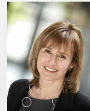
Katrin Schütz Staatssekretärin im Ministerium für Wirtschaft, Arbeit und Wohnungsbau des Landes Baden-Württemberg

Im Namen der Landesregierung gratuliere ich Ihnen herzlich zum 125-jährigen Bestehen und wünsche Ihnen für die Zukunft weiterhin vielfältige interessante Projekte und viel Erfolg.